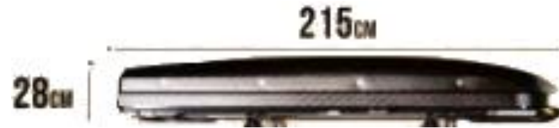
Dimensions de la tente de toit